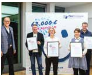
Kunst & Kultur