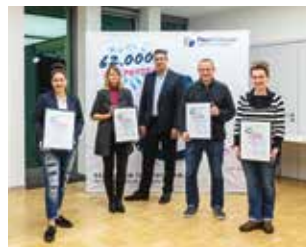
Nachbarschaft & Soziales