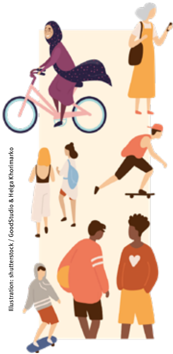
Illustration: shutterstock / GoodStudio &amp; Helga Khorimarko