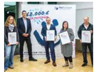
Umwelt & Naturschutz