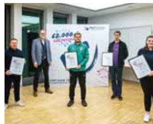
Sport & Freizeit