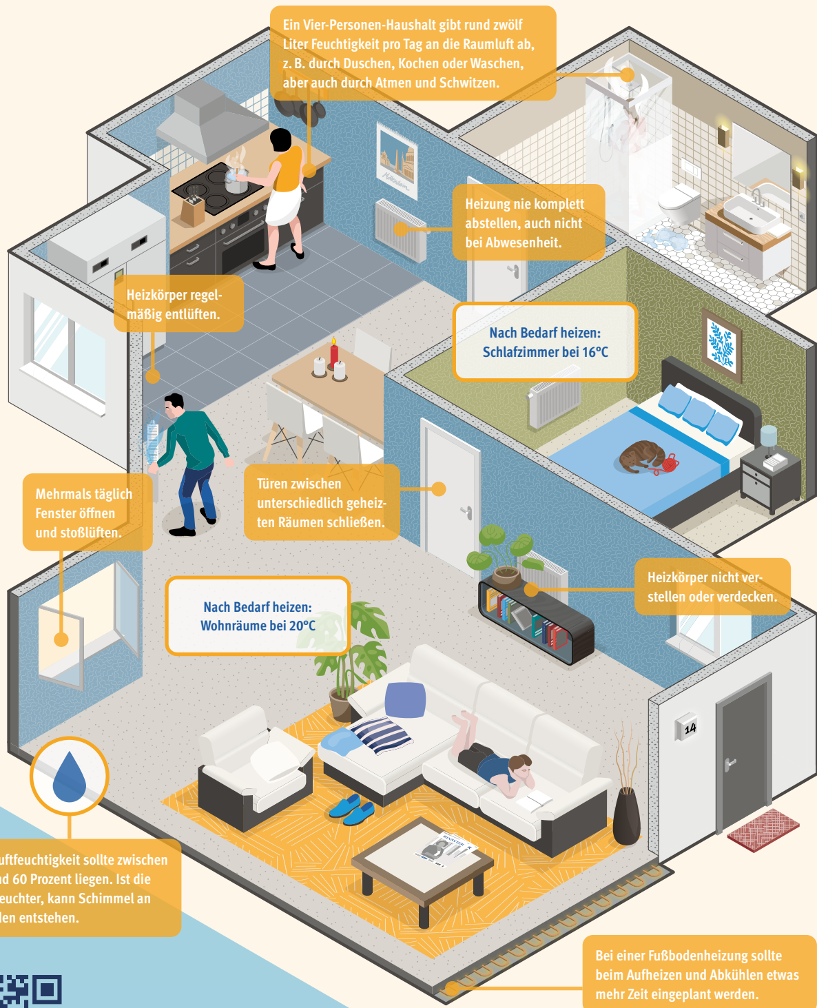
Illustration: Niko Wilkesmann

Wenn es draußen kalt wird, haben wir es in unseren vier Wänden gern schön warm. Damit in Ihrem Zuhause ein Wohlfühlklima und keine tropischen Verhältnisse herrschen, empfiehlt die EINSVIER folgende Checkliste.