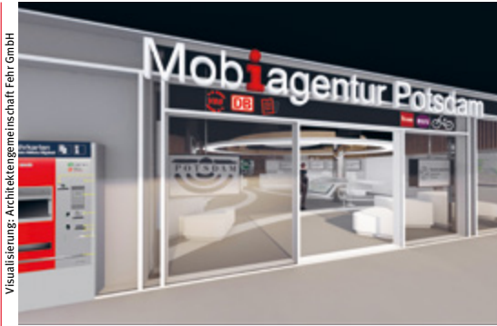
Visualisierung: Architekturgemeinschaft Fehr GmbH