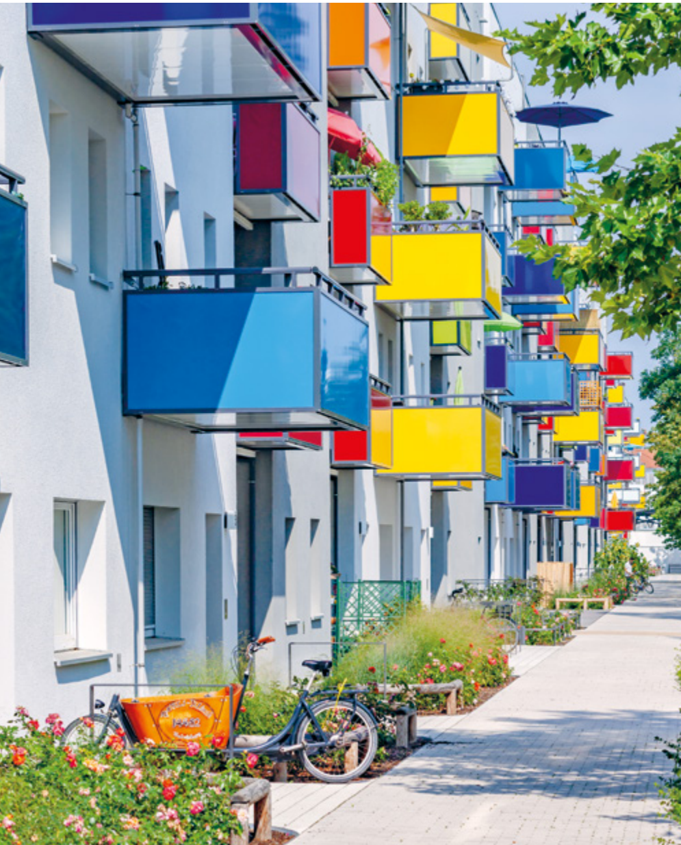
Aus Einheitsplatte wird Musterbeispiel: Die sogenannte Rolle in Drewitz erstrahlt in neuen Farben.