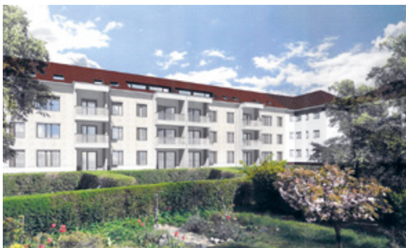
Visualisierung: Ingenieurbüro S & P Sahlmann

BORNSTEDTER FELD Hier baut die ProPotsdam aktuell 274 Wohnungen: Auf dem Areal der ehemaligen Tram-Wendeschleife an der Viereck-Remise entstehen 117 Wohnungen, davon 88 mit Mietpreis- und Belegungsbindungen. Das Besondere: Alle Wohnungen werden barrierefrei sein, im Erdgeschoss ziehen eine Tagespflege und eine Sozialstation mit Begegnungstreff ein. An der Leonardo-da-Vinci-Schule schafft die ProPotsdam weitere 157 barrierefreie Wohnungen, davon 118 mit Mietpreis- und Belegungsbindung. Auch vier Wohngemeinschaften für Demenzzranke finden Platz. Insgesamt errichtet die ProPotsdam bis zum Jahr 2027 2.500 neue Wohnungen.