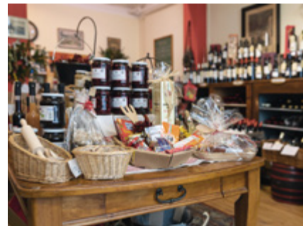
Erlesene Spezialitäten aus nah und fern Seite 26