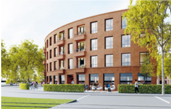
Visualisierung: Baumschläger Eberle Architekten

Potsdam wächst. Deshalb wird an allen Ecken der Stadt gebaut, auch viele Wohnungen. Wir zeigen die wichtigsten Vorhaben.