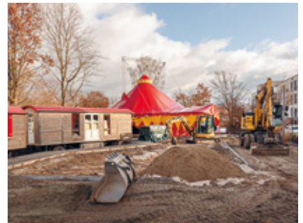
Der Circus Montelino hat viel vor am neuen Standort Seite 14