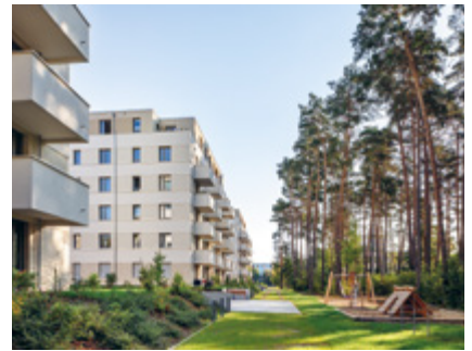
Bauen, was die Potsdamer sich wünschen Seite 8

TIPPS UND SERVICE 31 Grüne Oasen, Großes Reinemachen