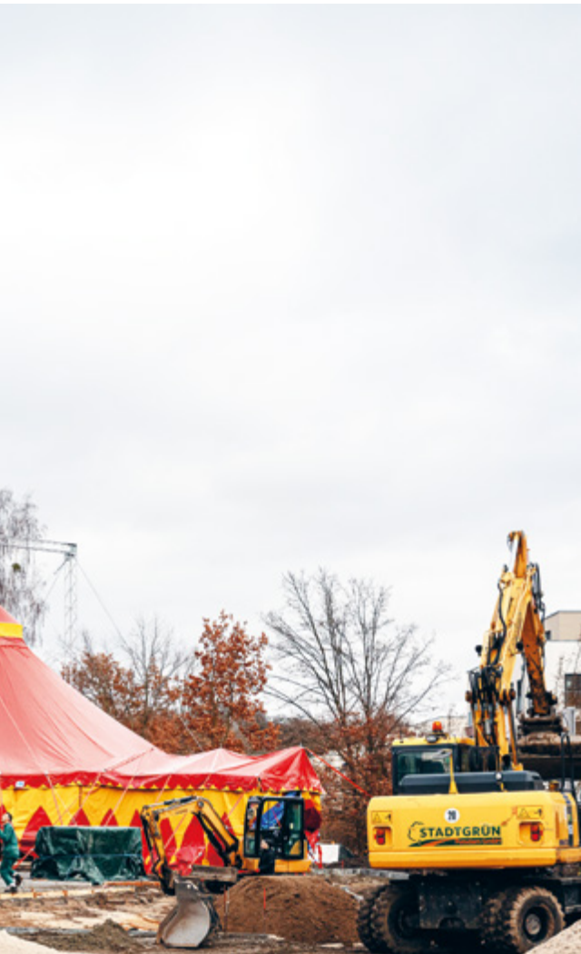
Mit einem Kran wurde der Zirkuswagen an seinen neuen Standort transportiert.